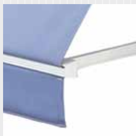
Utvändig manövrering med dragband av polyester.